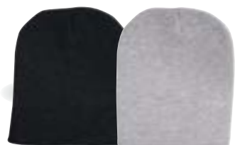
DARK GREY MARLE GREY MARLE