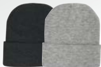
DARK GREY MARLE GREY MARLE